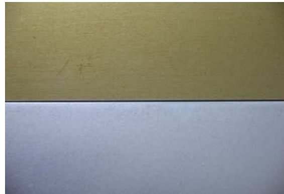
Oben: Nanokeramik Unten: Stahl unbehandelt

Produktionsteil nach der Nanovorbehandlung Die Haftung ist aufgrund der Schicht- charakteristik (extrem dünn, sehr große Oberfläche) besser als bei der Zinkphosphatierung. Weder im Anliefe- rungszustand noch bei der Verarbeitung sind Nano-partikel vorhanden. Eine Gesundheits-gefährdung durch Kontamina- tion entfällt. Lediglich die abgeschiedene Schicht liegt im Nanobereich.